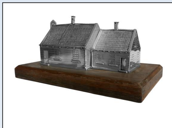
Meesterwerk nr. 21: Zaans huisje