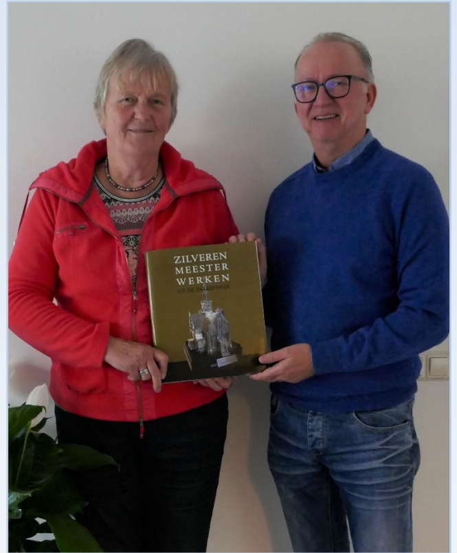
Eerste opzet van het boek: Zilveren Meesterwerken uit de Zaanstreek